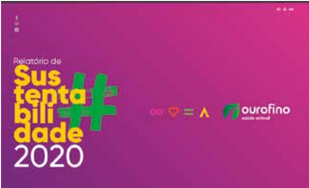
Relatório de Sustentabilidade da Ourofino referente a 2020