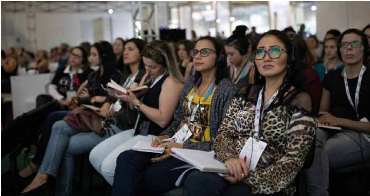
Na última edição, médicos-veterinários, executivos do setor e estudantes visitaram a feira e prestigiaram a programação dos auditórios

Evento acontece de 04 a 06 de outubro, em São Paulo, com foco em animais de companhia