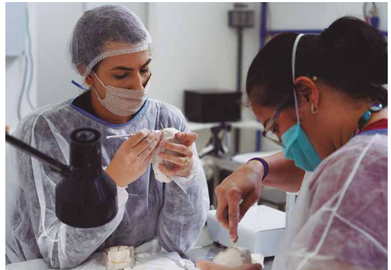
A Anclivepa-SP possui hoje 40 cursos de especialização nas mais diversas áreas da medicina veterinária

A expertise e tradição da Anclivepa-SP em Medicina Veterinária, aliada a grandes estratégias de gestão, tornaram-se ferramentas fundamentais para seu sucesso e crescimento durante a pandemia